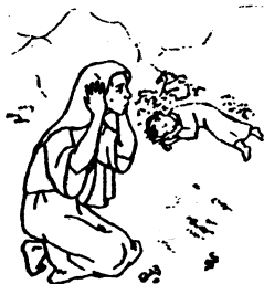
Hagar en Ismaël

Ge. 21:12 God: "want in Izak zal uw zaad genoemd worden"; citaat in Ro. 9:7,8. Norm: niet de kinderen des vlees (natuurlijke afstamming), maar de kinderen der belofenis zijn kinderen Gods; Jh. 1:12,13 (door geloof uit God geboren). Zaad van Abraham: